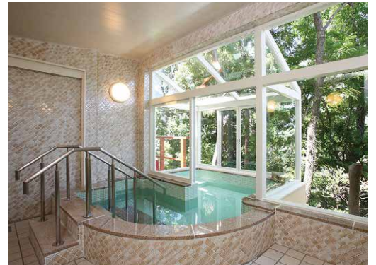
明るく美しい大浴場は、心身を癒す人気のスポット