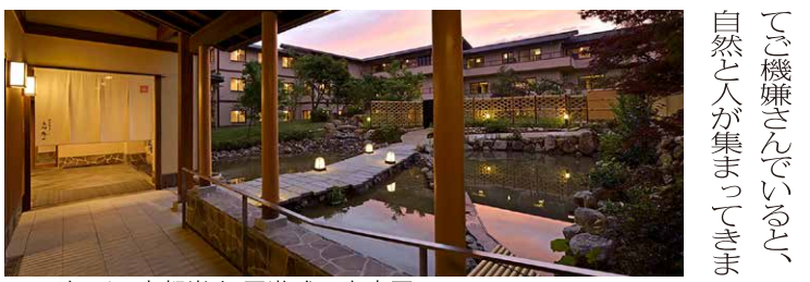
ロングライフ京都嵐山 回遊式日本庭園

「笑うことが健康にいい、というのは皆さんなんとなくご存じだと思います。今日、京都へ来る新幹線の中で読んでいた本にも、難病を宣告された海外の作家が、お医者さんに『私が自分で治します』と宣言し、家でお