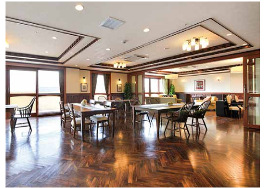
広々としたレストランでは、素材を活かした自慢の料理に舌鼓

まれて、快適に過ごすことができます。窓も大きく、刻一刻と表情を変える日光や風、景色をゆっくりと楽しめます。明るく開放的な住空間は心まで解きほぐしてくるよう。ここでは、時間の流れ方が違う気がします。