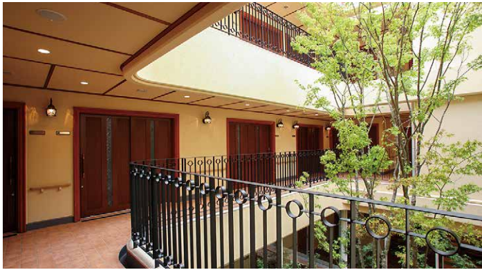
中庭のシンボルツリーがいつも見守ってくれています