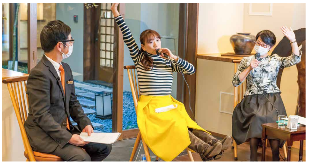
「毎日ストレッチをしていたら、今ではV字バランスもできるようになって、若い子に驚かれます」