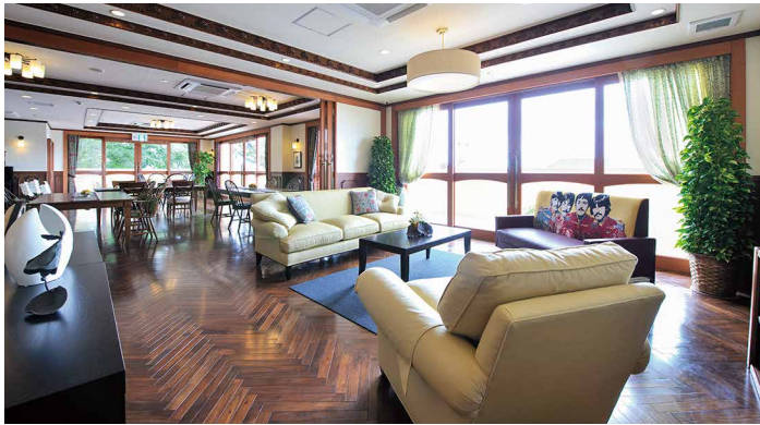
落ち着きのあるロビーでゆったり過ごす、くつろぎの時間