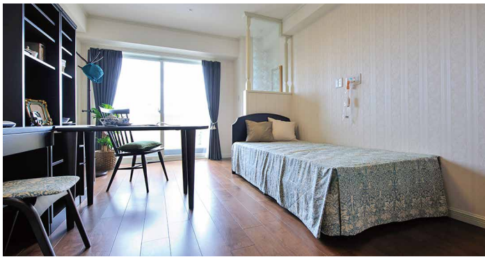
安全性と機能性に富んだ居室で穏やかなプライベートタイムを...