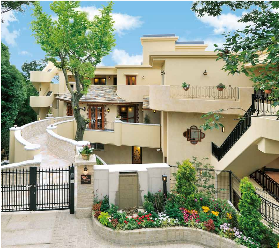
花と緑が溢れる、リゾートホテルのような佇まい

芦屋別邸」も、できる限り遺した敷地内の既存の樹木に花や緑を添え、水が流れ、風や光を感じられるように設計されています。自然の恩恵に満ちた造形は、まるで森にいるかのような安らぎを感じます。風にそよぐ木々