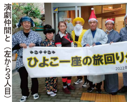
演劇仲間と（左から3人目）ある。

「音楽は心の遊びの部分」であり、自然の中にあふれている。と言っている。見えないものだけれど心がきれいになる、優しくなる。嬉しくもなるし悲しくもなる。そうした世界に自分の心を遊ばせながら、人びとの心をも、その中に誘い込んでいく活動を続け