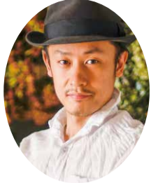
【花材名】 ・ガーデンローズ数種類 ・椿