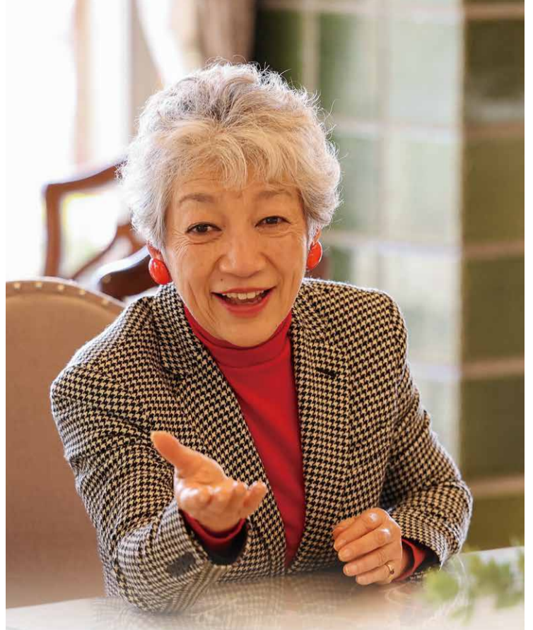
中尾ミエさん 1946年、福岡県生まれ。1962年にデビュー曲「可愛いベイビー」が大ヒット。1971年にリリースされたシングル曲「片想い」は30万枚の売り上げを記録するロングセラーに。その表現力は芝居にも生かされ、俳優としても数々のドラマ、映画、舞台に出演。軽快な話術も人気で、20代の頃からトーク番組にも多数出演。情報番組『5時に夢中!』(TOKYO MX)の金曜コメンテーターとしてレギュラー出演中。2008年には介護をテーマにした舞台『ヘルパーズ』の企画・プロデュース・主演を務め、2019年、2022年にブロードウェイミュージカル『ピピン』に出演。2019年には73歳で週刊誌のグラビアを飾るなど、70代にしてまだまだ挑戦を続けている。

「毎日、体を動かす習慣を持った方がいいですね。皆さんも、自分でやらないとダメよ！」 イキイキと魅力的な中尾さんのお話で盛り上がりました。