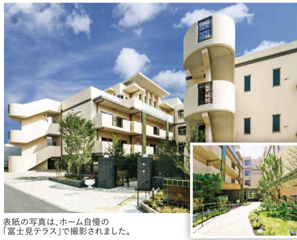
表紙の写真は、ホーム自慢の「富士見テラス」で撮影されました。

東急田園都市線の宮崎台駅から徒歩すぐ、見晴らしの良い高台に佇む「ロングライフ・クイーンズ宮崎台」は、緑に囲まれ、光と風に四季を感じる、開放的な住空間。落ち着いたインテリアは家族と暮らす一軒家のような安らぎを与え、行き届いたサービスは高級ホテルのような優雅な時間をもたらしてくれます。ゆったりと穏やかに、いきいきとアクティブにも、ここは人生を彩る拠点。毎日を楽しむためのホームベースなのです。