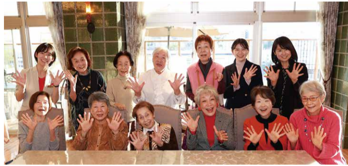
対談に参加した、ロングライフ・クイーンズ宮崎台のお客様と一緒に「かわいいベイビ〜、ハイハイ!」の掛け声で、ハイ、ポーズ!

中尾「老人ホームには『何もしてないですよ』というところがありますが、それは親切ではありません。ラクしちゃ