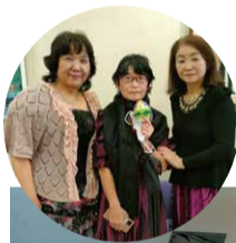
アマビエーラ 指導メンバー