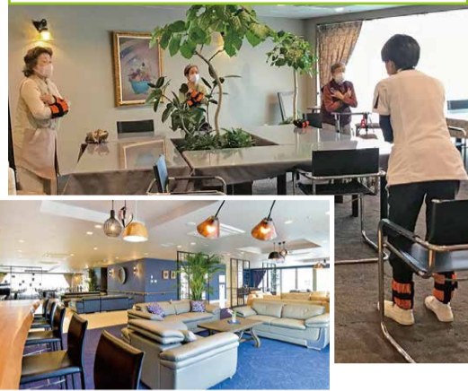
【ロングライフ・クイーンズ静岡呉服町】

「好きなことをする」というのは若々しさや元気の源になります。そこで、ロングライフではいくつかのホームに理学療法士を配置し、動ける健康なからだづくりをサポート。その取り組みについて、「ロングライフ・クイーンズ静岡呉服町」の理学療法士にお話を伺いました。