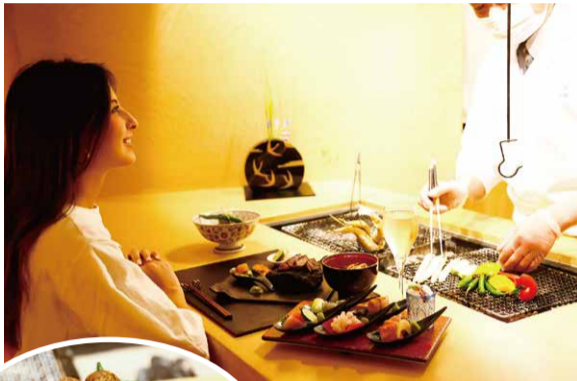
おいしく美しい料理に心も満たされる

お待ちかねの夕食は、和食専門のシェフが手掛ける創作懐石料理。お刺身は静岡焼津のマグロや東伊豆町稲取の地キンメ(キンメダイ)など近場で獲れる新鮮なお魚、メイシンの肉料理には神奈川県足柄牛、その他、箱根町の梅、芦ノ湖のワカサギなど、地産地消をベースに全国の選りすぐりの食材を使った季節感あふれるお料理をいただけます。「季節を七十二候(しちじゅうにこう)に分けて、ちょっとした季節の移ろいを料理に表現していま