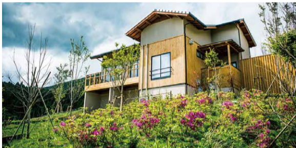
一棟貸し切り。プライベートリゾートの極み