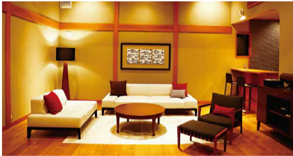
ご家族でゆっくり寛げる広さです