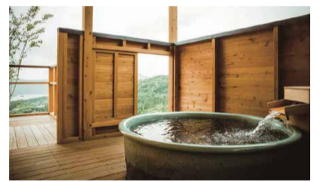
夜は満天の星、朝は芦ノ湖と山々を眺めながら...

も、地元の氏神様で1月には初詣で賑わうという芦ノ湖の箱根神社もおおすすめです。開運をもたらす神様として信仰を集める関東屈指のパワースポット。この箱根神社と箱根元宮、九頭龍神社(本宮)は箱根の中でも最強のパワースポットとされ、これらをすべて参拝する「箱根三社参り」が人気とのこと。2023年の開運を願って詣でみましょうか。「箱根別邸」を拠点にした湯と自然と癒しの旅! 皆さまいかがですか。