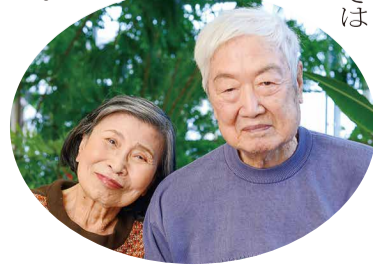
メイクを終えられ、ご夫婦で仲良く記念撮影。手をつないだり、寄り添ってポーズをとったりと楽しい時間となりました。