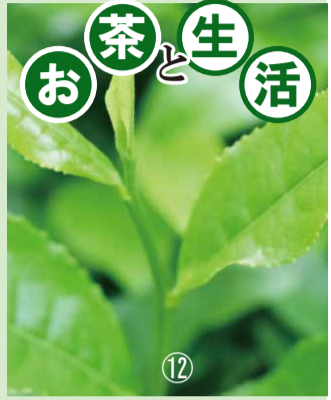
東京農業大学総合研究所 研究会元会員 文部大臣賞受賞・園芸 藤井登起男