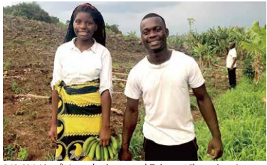
NMNサブリの売上の一部をモザンビークの若い農夫の支援にあてます