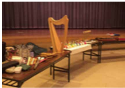
楽器を使い分けて楽し聞かせる

感性を探り、辿り、蘇らせ、その人の心の世界を活性させていく。表情が変わって、目がいきいきとし、口元がやわらかなリズムに合わせて動き始める。音楽という世界から流れる力は、人びとの心を高揚させ、音楽の奏でるステージの中で、活動を開始させる。それは見事な演出者であり、助演者でもある。