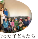
難民となった子どもたち