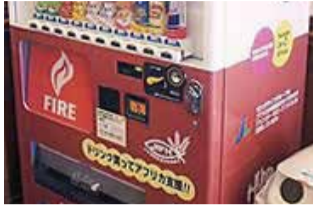
ロングライフの全てのホームに設置されたハンガーゼロ自動販売機

同機構が取り組む「ヤングファーマーズパートナーシップ」も若い農夫を育てることで持続可能な農業を叶えるものです。ロングライフグループも、様々な知恵を出し合い、東アフリカ・モザンビークの若い農夫を支援しようとして「LONG LIFE NMN」の売上金の一部を寄付することになりました。 その他、世界の子どもたちのサポートや売上金の一部が寄付される自動販売機の全ホームの設置、災害時の寄付など、ロングライフグループは様々な形でこのハンガーゼロの取り組みを応援しています。