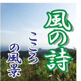
風の詩 ころろの風景

山や野辺を覆う緑が粘りこきを見せつけている。その逞ましさ、力強さは見る者に元気を与えてくれる存在として迫ってくる。春の風が、また遠くにあつた頃、葉の一枚も付けない樹木の体は小さく、細く、たよりない風情で、ふるえていたのではなかったか。地の中で溜め込んだエネルギーを吸いあげながら、来た時を待ちわびる期待と忍耐力を、どれ程の注意力で見つめたといえるか。いま、人びとの気力や活力の程はどうか。語る言葉にも、見つめる目の力にも、未来を探ることにも揚々とした意気を感じることが少ないと感ずるが。現代社会は人間を勇気づけるエネルギーは溜められていないのか。使い果たしたのか。消費文明という軽い言葉の中で。物と経済力が闊歩する社会は、人の心の存在を希薄にして縮む時代なのか。人間の姿を合わせ鏡の中に見ながら、大自然の摂理に学ぶ時か。