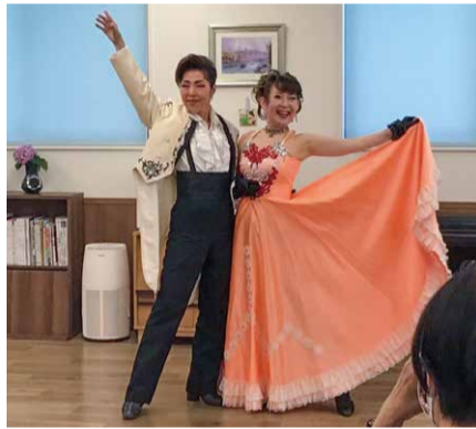
宝塚歌劇団OGで結成されたユニット「ガイアクローチェ」の様子の様子です

また、『ローズガーデン平野』はお食事がおいしく、評判です。ロングライフダイニングの栄養士がおいしく、栄養バランスのとれたメニューを立て、心を込め