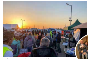
ポーランドとの国境にあるメディカの検問所にとどまっている人々